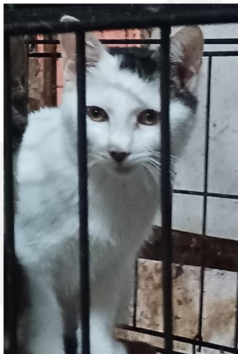
みんな 年齢：4ヶ月 血液検査：エイズ、白血病共に陰性。

栃木出身の4兄妹。唯一の女の子ですが、一番食欲旺盛です。元気いっぱいですが、兄弟一緒だと安心です。完全内飼い、脱走対策、終生飼育をお願いしております