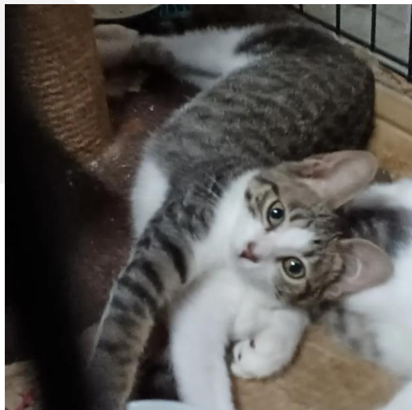
名前：めんめん 年齢：4ヶ月 血液検査：エイズ、白血病共に陰性。

栃木出身の4兄妹。唯一の女の子ですが、一番食欲旺盛です。元気いっぱいですが、兄弟一緒だと安心です。完全内飼い、脱走対策、終生飼育をお願いしております