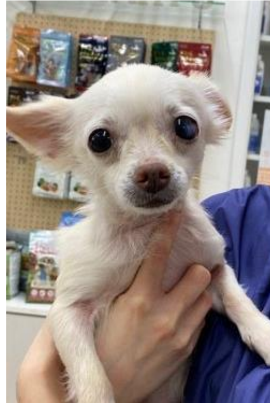
しずか チワワ 女の子 推定3才くらい 3kg

とてもビビリさんですが、おやつがあると寄ってきます。ごはんが大好きでご飯前はわんわん吠えています。びびりでも噛んだりはしません。抱っこをしてリラックストレーニング中です。多頭で暮らして来た子なので、他犬達とも上手にお付き合いの出来る子です。トイレはまだ訓練中です。大人しい子なので初心者の方でも大丈夫です。