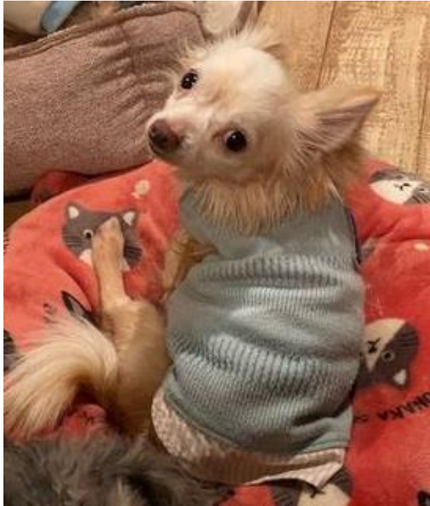
はく チワワ 男の子 推定5~6才くらい 3.1kg

初めは人見知りするかもしれませんがすぐに慣れてくれると思います。おやつには目がなくておやつがある時はそばを離れません。基本穏やかな子です。他犬とは上手にお付き合いの出来る子ですので、先住さんがいても大丈夫ですよ。トイレトレーニング中です。