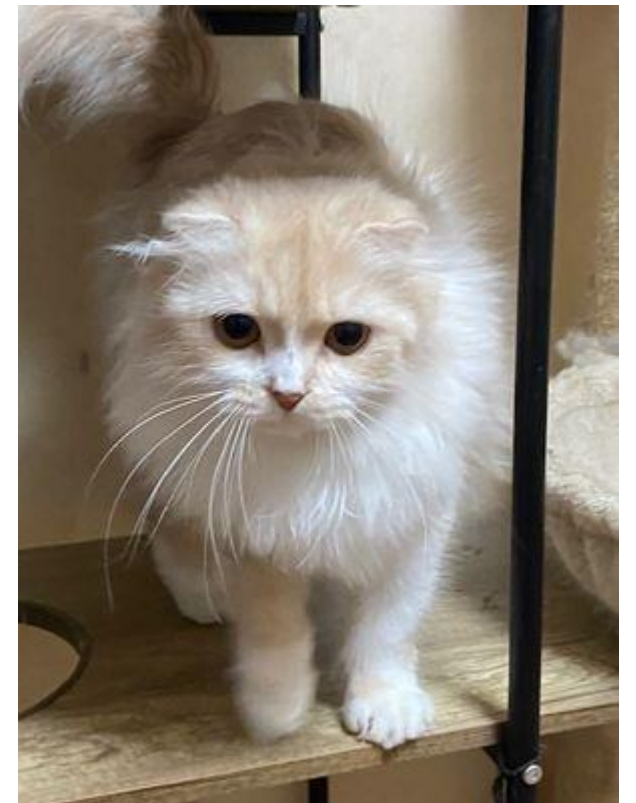
きなこ スコティッシュフォールド 女の子 1歳くらい

マイペースですが、とても大人しく初心者の方でも飼える子です。長毛ですので毎日のブラッシングが必要です。ペットサロンでも大人しくシャンプー出来ます。