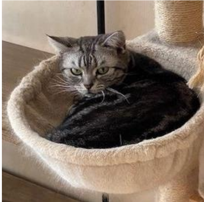
杏莉 アメリカンショートヘアー 女の子 3歳11か月

シャイガールですが、手のかからないマイペースな子です。ちゅーるが大好きでちゅーるタイムはスリスリになります(笑)。猫同士は相性があるため1匹飼いを希望しています。