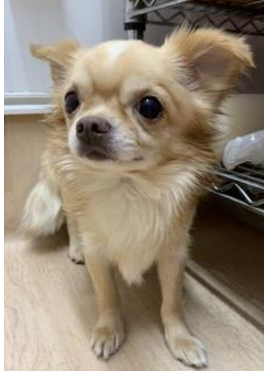
むぎ チワワ 男の子 推定3~4才くらい 2.9kg

初めは人見知りするかもしれませんがすぐに慣れてくれると思います。おやつには目がなくておやつがある時はそばを離れません。基本穏やかな子です。他犬とは上手にお付き合いの出来る子ですので、先住さんがいても大丈夫ですよ。トイレトレーニング中です。